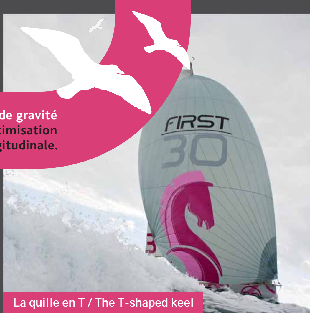
La quille en T / The T-shaped keel

Ein T-Kiel für einen so tief wie möglichen Massenschwerpunkt und eine Optimierung des Trimmwinkels.